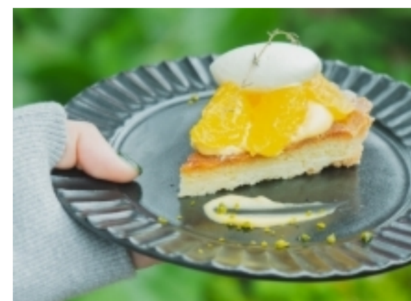
今だけの、初夏の味わい 柑橘のタルト 土日限定 ¥550

自家製コーヒーゼリーとバニラアイス、アクセントにアーモンドのキャラメリゼをトッピングした、バランスのいいスイーツ。