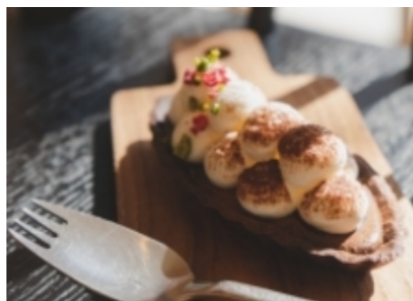
チョコを楽しむ、大人のタルト タルト・オ・ショコラ ¥660

濃厚なガナッシュとアーモンドの風味のタルト生地に甘さ控えめな生クリームをたっぷり絞り仕上げた、濃厚で大人なタルト。