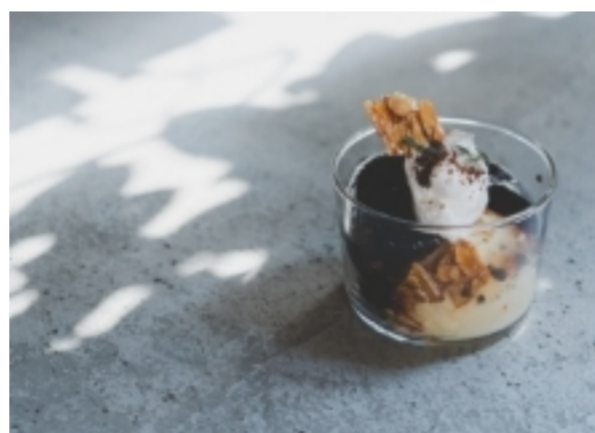
パティシエのこだわりが詰まった 自家製コーヒーゼリー ¥528

チョコレートをつぶり使ったクラシックな焼き菓子。小麦粉は不使用のグルテンフリーなので体にも優しい。