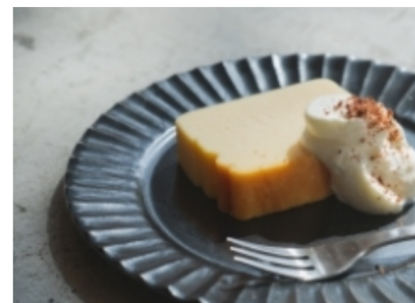
クリーミーで、さっぱり チーズケーキ ¥484

濃厚なガナッシュとアーモンドの風味のタルト生地に甘さ控えめな生クリームをたっぷり絞り仕上げた、濃厚で大人なタルト。